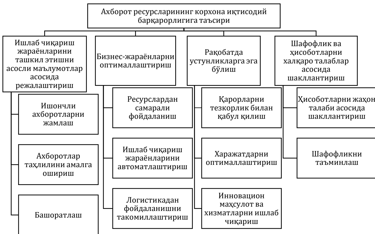
2-чизма. Ахборот ресурсларининг корхона иқтисодий барқарорлигини таъминлашдаги аҳамияти

Фикримизча, ахборотни самарали тўплаш, қайта ишлаш, таҳлил қилиш ва фойдаланиш қобилиятиги эга бўлиш бозор шароитлари жадаллик билан ўзгариб бораётган, рақобат ва технологик жараёнлар тараққиётининг кучайиши шароитида муваффақиятга эришишнинг асосий омилларидан бири ҳисобланади. Ушбу ресурслар ишлаб чиқариш жараёнларини оптималлаштириш, маркетинг ва сотув самарадорлигини ошириш, хавф-хатарни бошқариш, инновацияларни ва ривожлантиришни қўллаб-қувватлаш, рақобатбардошликни мустақкамлаш ҳамда хўжалик юритиш фаолиятининг шафоқлигини таъминлаш учун шарт-шароит яратади.