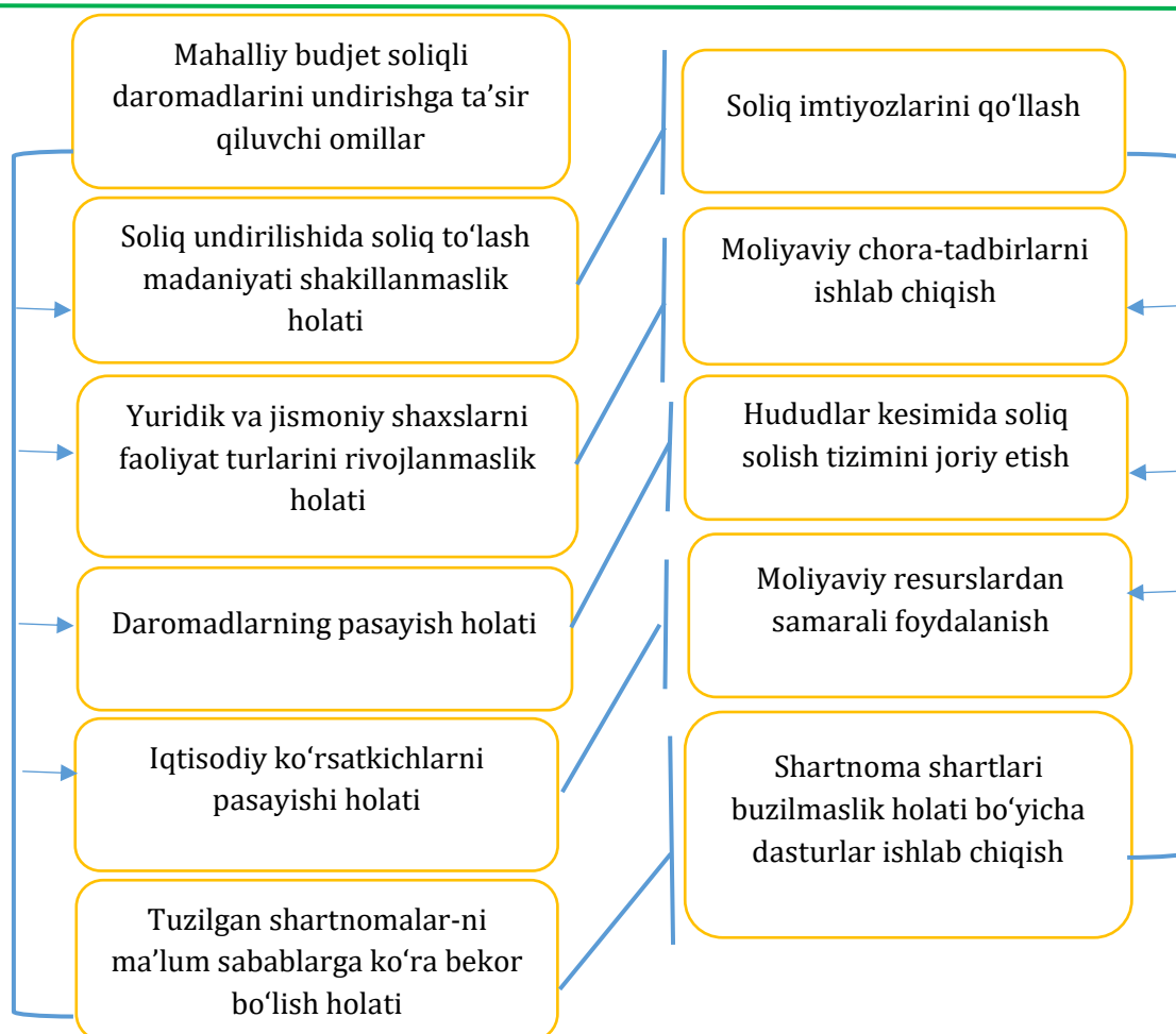
2-rasm. Mahalliy budjet soliqli daromadlarini undirishga ta'sir qiluvchi omillar