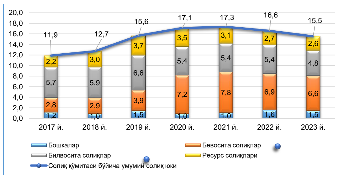
2-расм. Солиқ гуруҳлари бўйича солиқ юкининг таркиби динамикаси

Бундан ташқари, тўғри солиқлар инфляция даражасига тўғридан-тўғри боғлиқ эмас, тушумлар динамикаси эса улар билан бевосита боғлиқ эмас – фойда солиғи ва даромад солиғи бўйича даромадлар солиқ солиш объектлари динамикаси ва белгиланган ставкаларнинг характеридан келиб чиққан ҳолда инфляция даражасидан орқада қолиши ёки ошиши мумкин.