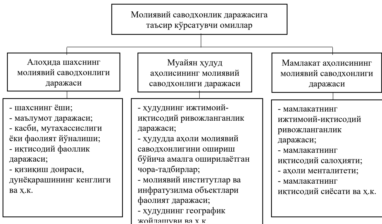
2-расм. Молиявий саводхонлик даражасига таъсир кўрсатувчи омилларнинг турли даражалар бўйича табақаланиши.

Фикримизча, аҳоли молиявий саводхонлиги тушунчаси ўта даражада умумлаштирилган мазмун касб этиб, уни молиявий саводхонлик даражасига таъсир кўрсатувчи омилларнинг юқорида келтирилган таснифи тўлиқ ифодамайди. Унинг мазмун-моҳиятига чуқурроқ кириб бориш ўз навбатида мазкур тушунчанинг турли (масалан, алоҳида шахс, муайян ҳудуд аҳолиси, мамлакат аҳолиси) даражаларини табақалаштиришни тақозо этади (2-расм).