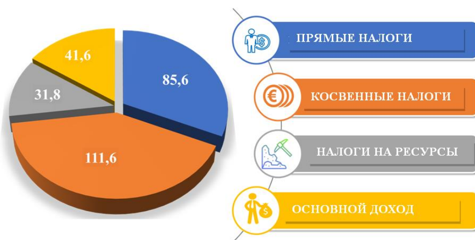
Рис. 1 Прогноз доходов государственного бюджета на 2024 год, трлн сумов

Доходы Государственного бюджета на 2024 год прогнозируются в размере 270 703 млрд сум., или 20,8% к ВВП. Из них, поступления по прямым налогам прогнозируются на 85,6 трлн сумов, или на 12,3 трлн сумов (117 процентов) больше, чем ожидалось в 2023 году (рис 1.).