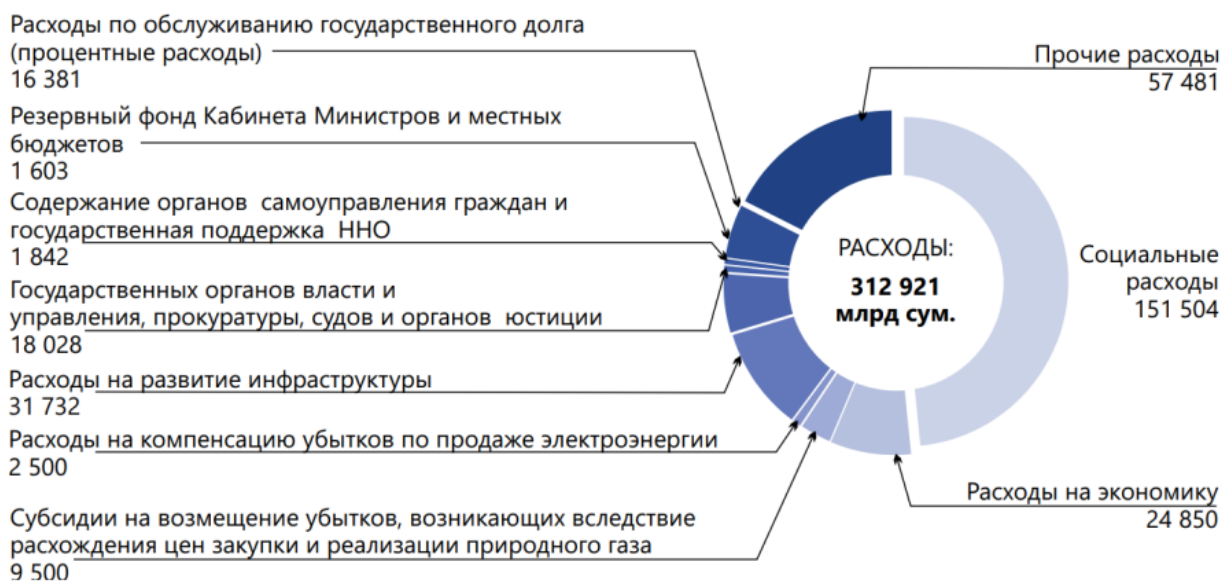
Рис. 3 Структура расходов государственного бюджета, прогнозируемые на 2024 год

долга, текущий ремонт, оплату основных инструментов и инвентаря, другие услуги и т.д.